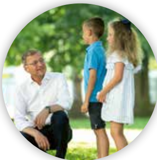
Thomas Stelzer Landeshauptmann

„Die beste Bildung braucht auch die besten Rahmenbedingungen. Wir wollen Oberösterreich zum Kinderland Nr. 1 machen.“