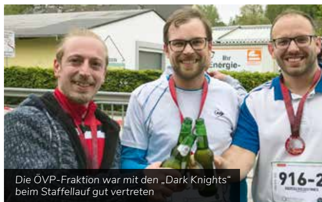
Die ÖVP-Fraktion war mit den „Dark Knights“ beim Staffellauf gut vertreten