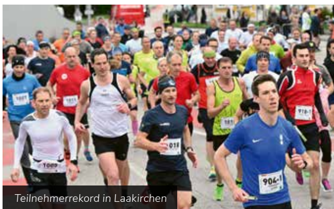
Teilnehmerrekord in Laakirchen

Ebenso danke ich der Stadtgemeinde Laakirchen für die finanzielle Unterstützung, die es vielen Kinder und Jugendlichen ermöglicht hat, teilzunehmen. Ich freue mich auf die weitere Zusammenarbeit und hoffe auf eine neuerliche Durchführung des Papierstadtlaufs im kommenden Jahr.“